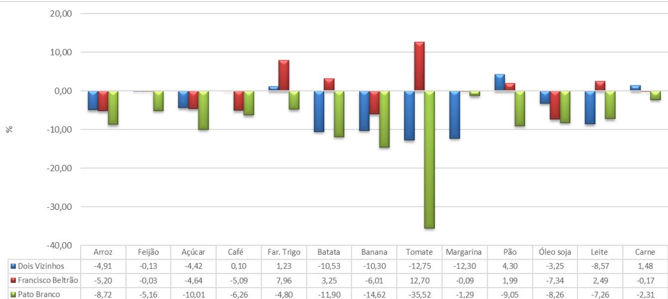
Gráfico 01 - Variação % mensal dos preços dos itens da Cesta Básica – Dois Vizinhos, Francisco Beltrão e Pato Branco, janeiro /2026.