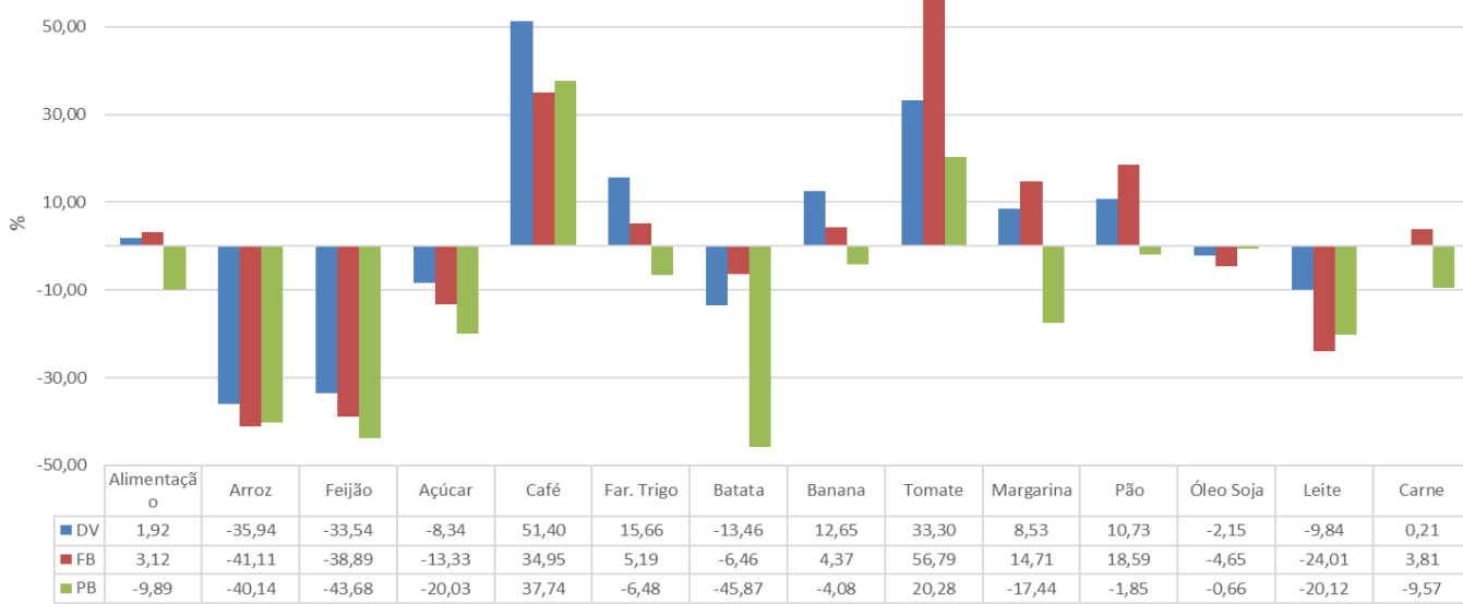
Gráfico 02 – Variação % acumulada entre janeiro de 2025 a janeiro de 2026, Dois Vizinhos, Francisco Beltrão e Pato Branco.

No acumulado de janeiro de 2025 a janeiro de 2026, o custo médio da Cesta Básica de alimentação apresenta um aumento em Dois Vizinhos de (1,92%), em Francisco Beltrão de (3,12%), e em Pato Branco uma queda de (-9,89%).