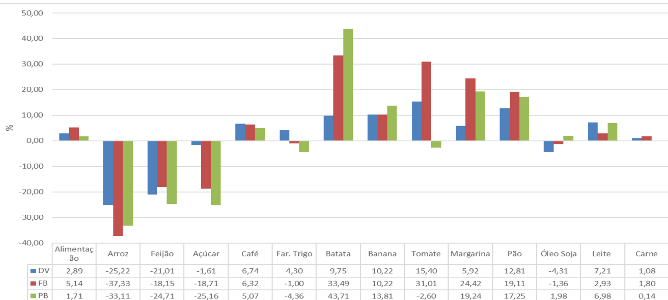
Gráfico 02 – Variação % acumulada entre março de 2025 a março de 2026, Dois Vizinhos, Francisco Beltrão e Pato Branco.

No acumulado de mar/2025 a mar/26, o custo médio da Cesta Básica de alimentação apresenta aumento em Dois Vizinhos de (2,89%), em Francisco Beltrão de (5,14%) e em Pato Branco de (1,71%).