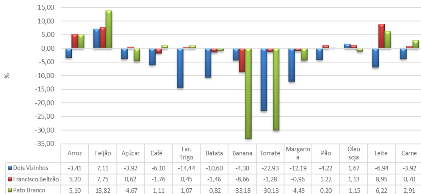
Gráfico 01 - Variação % mensal dos preços dos itens da Cesta Básica - Dois Vizinhos, Francisco Beltrão e Pato Branco – janeiro/2023.